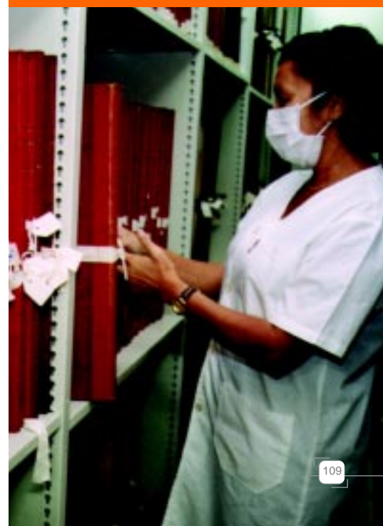
Técnica em atividade num dos acervos históricos do IFCH

O aluno com interesse especial em algum outro assunto pode ainda aprofundar a compreensão por meio do Estudo Dirigido, caracterizado por grupos de estudo reduzidos que têm a oportunidade de debater itens específicos com um professor. Ou seja, existem diversas oportunidades para que o aluno de História da Unicamp escolha uma ou demais áreas de interesse e amplie suas pesquisas e reflexões.