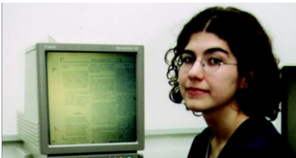
Lerice: pesquisa de ocorrências policiais no início do século 20

A estudante diz aprovar a linha de trabalho do curso, que fomenta o interesse e a preparação para lidar com a pesquisa. "A pesquisa é tudo em História, a gente aprende fazendo", resume.