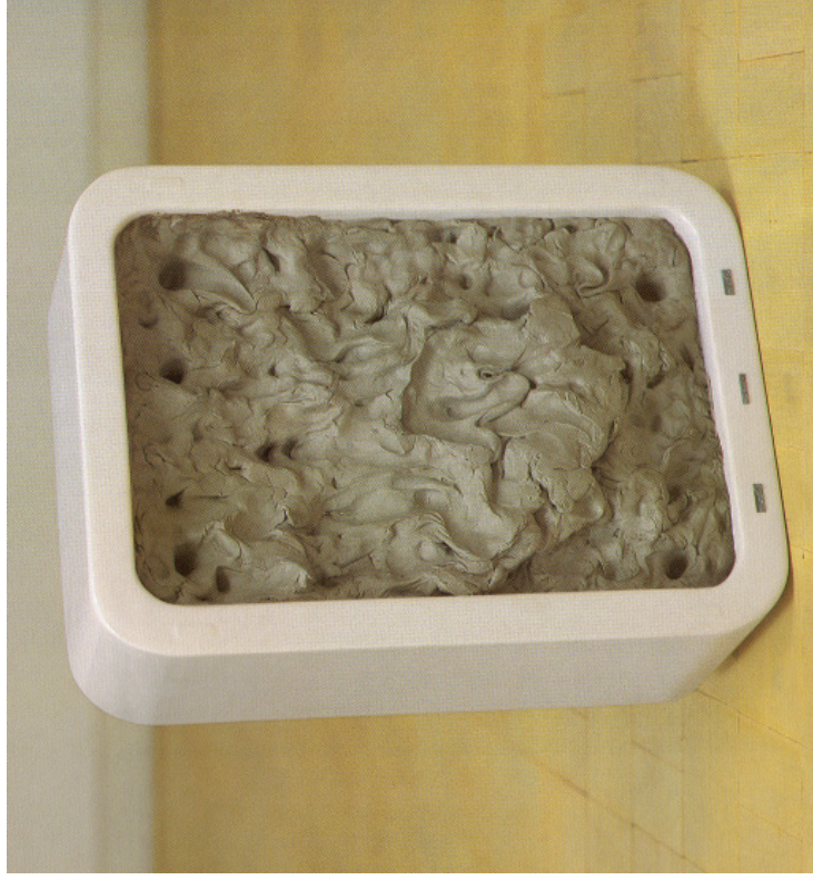
2) Espelho cego, Cildo Meireles , 1970. Madeira pintada, borracha e chapas de metal, 49 x 36 x 18 cm.