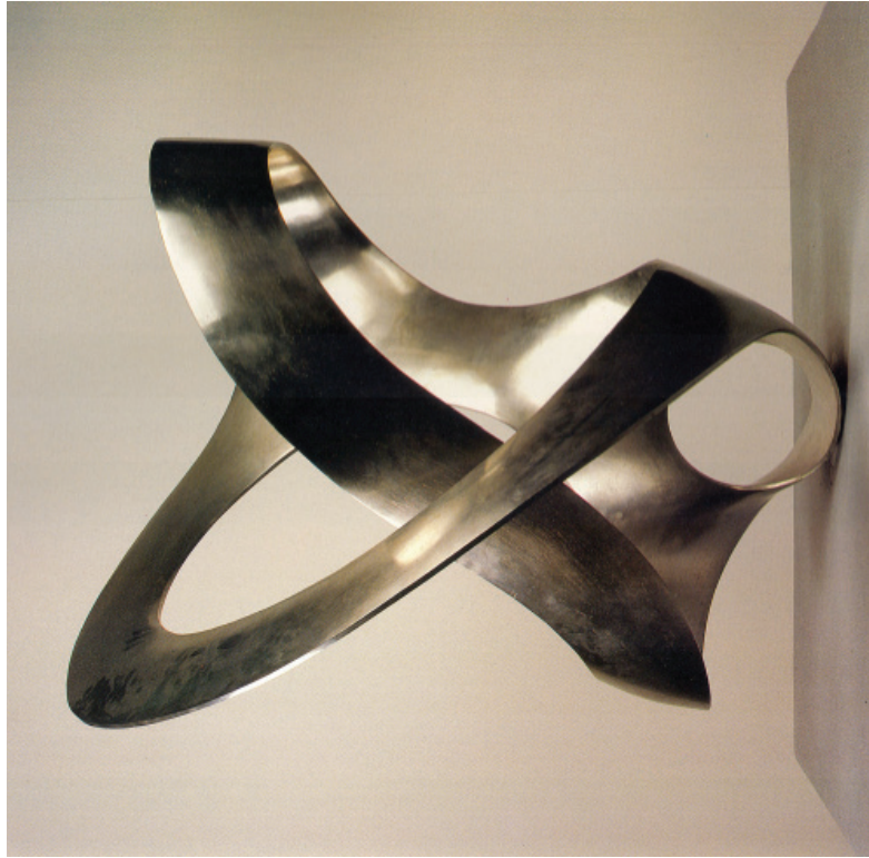
1) Unidade Tripartida, Max Bill , 1948/49. Aço inoxidável, 114 x 88,3 x 98,2.